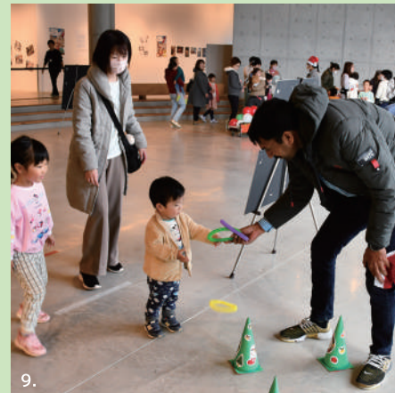
1.「日本語学習支援をつづけるためのヒント」講座 2.「やさしい日本語」講座 3. 旅する気分♪「ブラジルのカインカイ遊び」 4. 防犯・防災セミナー「Safety Seminar」 5.「日本語学習サポート入門」講座 6. 10代～30代のための英会話 CAFE「OPEN ENGLISH」 7.「国際理解出前講座」 8. 旅する気分♪「フィリピンの食べ物・飲み物」 9.「留学生と一緒に！ Christmas Party」