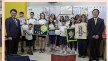
7月28日、徹明さくら小学校、藍川中学校の姉妹校であるリオ・ブランコ学園で交流。それぞれの学校から預かった提灯や絵画、メッセージフラッグなどを手渡しました。