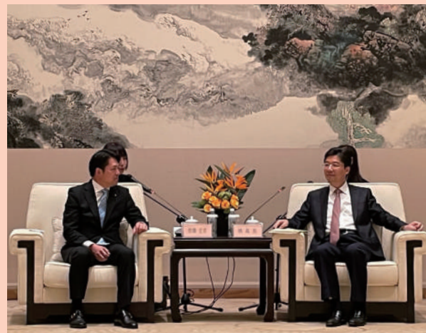
11月7日、姚高員(ようこういん)杭州市長と柴橋正直岐阜市長が、今後のさらなる交流について意見交換しました。