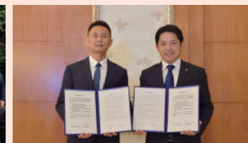
11月8日、淮安市内で、岐阜市の観光PRを行い、江蘇省文化観光庁との文化観光協力協定を締結しました。