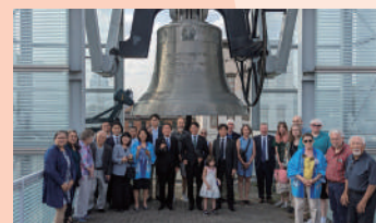
8月2日、岐阜空襲のあった7月9日に鐘を鳴らす「平和の鐘式典」が訪問日に合わせて開催され、世界の平和を祈りました。