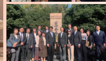
11月7日、杭州市人民政府関係者らと共に、柳浪聞鶯(りゅうろうぶんおう)公園にある日中不再戦碑を訪問。先人たちの偉業を振り返りました。