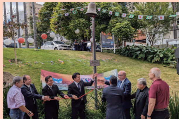
7月29日、岐阜空襲のあった7月9日に鐘を鳴らす「平和の鐘式典」が訪問日に合わせて開催され、世界の平和を祈りました。