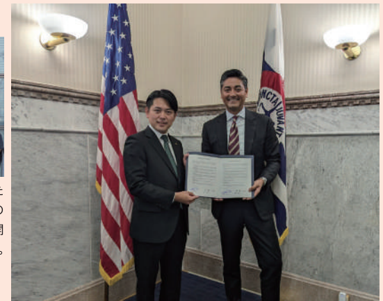
8月2日、アフタブ・ピュアヴァルシンシナティ市長と柴橋正直市長が意見交換を行い、姉妹都市交流覚書を取り交わしました。