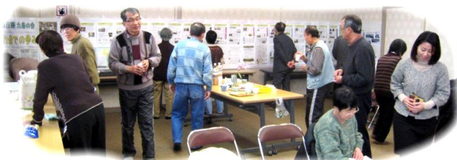
休憩時間に展示パネルを 閲覧したり、歓談する参加者