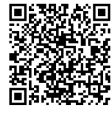
携帯用 QR コード