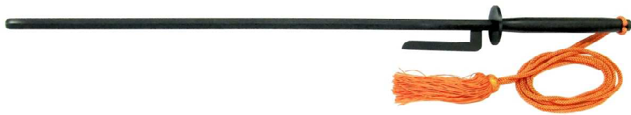
JT-5 打ち払い十手黒 六角14mm、全長77cm、刀身60cm 重量約1.29kg、鋼鉄製、房紐付 ¥18,500