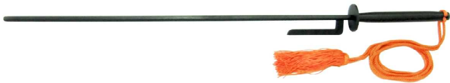
JT-2 打ち払い十手黒 六角10mm、全長77cm、刀身60cm 重量約900g、鋼鉄製、房紐付 ¥17,000