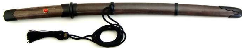
TT-22 鉄刀十手 柄(古色)・鞘(古色) 赤サンゴ飾 全長54.5cm、刀身35.5cm、ステンレス 重量530g、黒房紐付、布袋付 ¥29,000