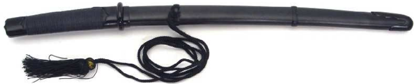
TT-4 鉄刀十手 柄(紐巻)・鞘(黒梨地) 全長54.5cm、刀身35.5cm、ステンレス 重量550g、黒房紐付、布袋付 ¥27,000