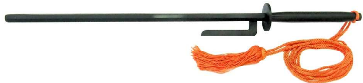
JT-3 打ち払い十手黒 六角14mm、全長62cm、刀身45cm 重量約1.09kg、鋼鉄製、房紐付 ¥17,500