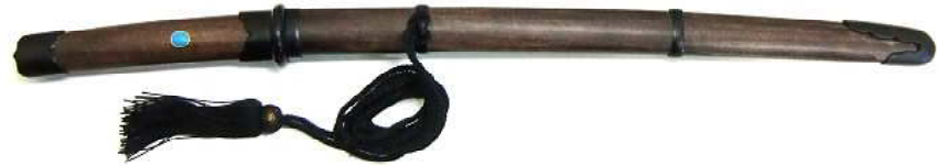
TT-21 鉄刀十手 柄(古色)・鞘(古色) トルコ石飾 全長54.5cm、刀身35.5cm、ステンレス 重量530g、黒房紐付、布袋付 ¥29,000