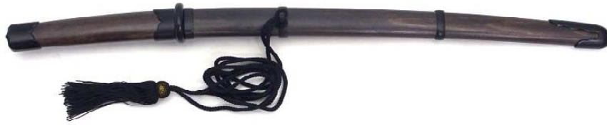
TT-2 鉄刀十手 柄(古色)・鞘(古色) 全長54.5cm、刀身35.5cm、ステンレス 重量530g、黒房紐付、布袋付 ¥26,500