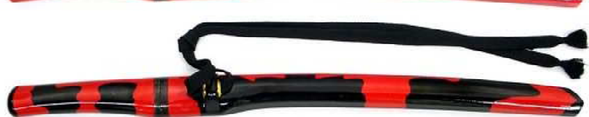
YG-4 柳生兜割 黒・朱鞘 全長58.5cm、刀身37.5cm、ステンレス ¥22,600