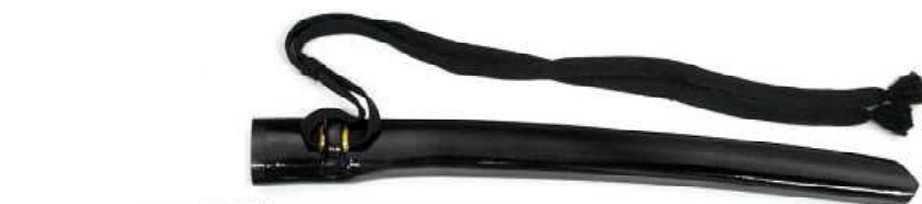
YG-2 柳生兜割 黒鞘 全長58.5cm、刀身37.5cm、ステンレス ¥20,500