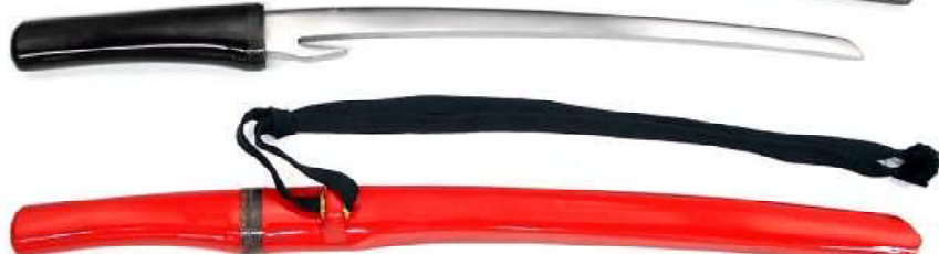
YG-3 柳生兜割 朱鞘 全長58.5cm、刀身37.5cm、ステンレス ¥20,500