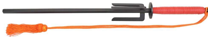
JT-33 与力三方鉤十手黒 六角14mm、全長62cm、刀身45cm 鋼鉄製、房紐付 ¥21,000