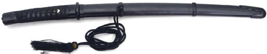
TT-3 鉄刀十手 柄(刀紐巻)・鞘(黒梨地) 全長54.5cm、刀身35.5cm、ステンレス 重量560g、黒房紐付、布袋付 ¥27,500