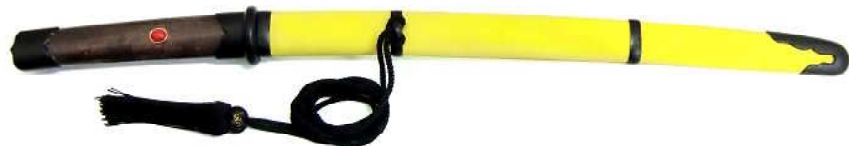
TT-12 鉄刀十手 柄(古色)・鞘(黄布巻) 赤サンゴ飾 全長54.5cm、刀身35.5cm、ステンレス 重量550g、黒房紐付、布袋付 ¥29,500