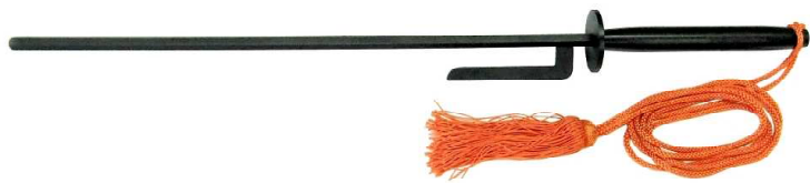
JT-1 打ち払い十手黒 六角10mm、全長62cm、刀身45cm 重量約800g、鋼鉄製、房紐付 ¥16,000