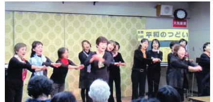
ミニコンサート:女性のうたごえコスモス

つどいでは、6年間の活動が報告され、また、ミニコンサートや平和に関する講演、トークタイムなど、盛りだくさんの催しが