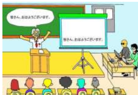
全体投影（ノートテイクも有り）