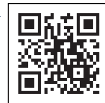
「コロナワクチンナビ」 二次元コード